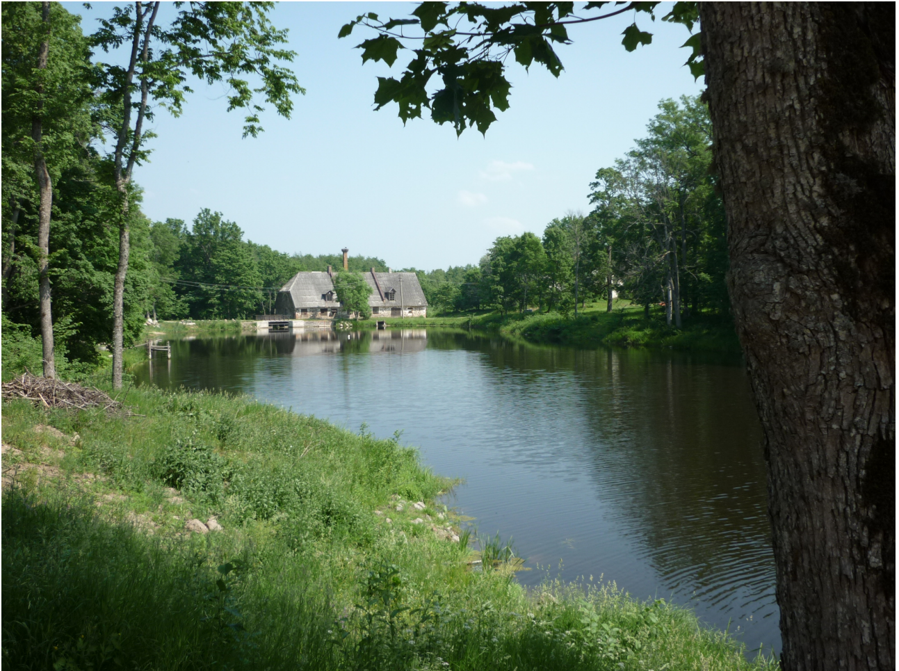
Lahmuse veski / Lahmuse Mill

J1 Navesti from Suure-Jaani Town Square 36.0 km